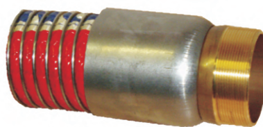
VNĚJŠÍ ZÁVIT - MS