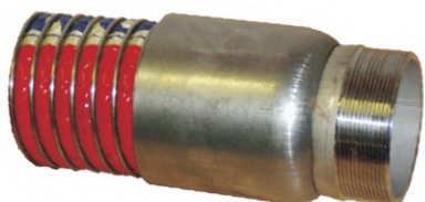
VNĚJŠÍ ZÁVIT - SS