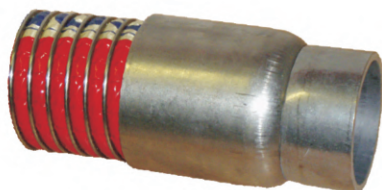
NAVAŘOVACÍ KONCOVKA (SS; FE)