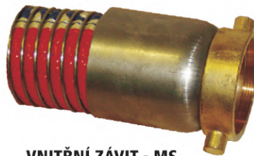
VNITŘNÍ ZÁVIT - MS