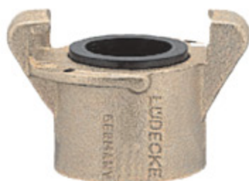
SANDBLAST IG Rychlospojka s vnitřním závitem kód 30166