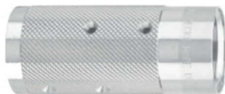
SANDBLAST DRŽÁK IG Držák trysky s vnitřním závitem kód 30167