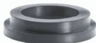
SANDBLAST TĚSNĚNÍ Profilované kruhové těsnění kód 30692