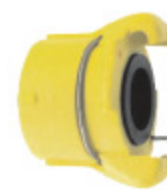
SANDBLAST IG kód 40214