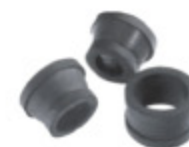
SANDBLAST TĚSNĚNÍ kód 30650