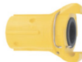
SANDBLAST PŘÍPOJKA kód 30651

Popis: Rychlospojky s bajonetovým uzávěrem pro spojování tryskacích hadic. Hadice se upevňují pomocí šroubů do vnější stěny hadice. Pro osazení konce hadic dodáváme držák tryskacích dýz. Z důvodu bezpečnosti práce doporučujeme rychlospojky zajistit dodávanými závlačkami. Provedení TN je za příplatek osazeno automatickou pojistkou - prodloužený nátrubek, nové řešení těsnící plochy.