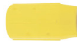
SANDBLAST IG NYLON kód 30652