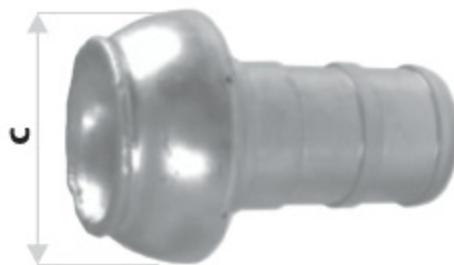
PERROT H TRN Ocelový hadicový trn bez háků kód 30170