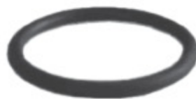
PERROT TĚSNĚNÍ Kruhové profilované těsnění BUNA (NBR) kód 30197