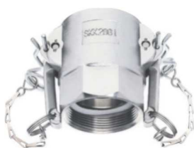
KAMLOK SNOW SKK I-G Rychlospojka s vnitřním závitem kód 30529