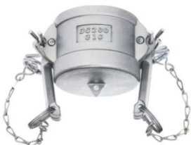
KAMLOK SNOW SKK DC Záslepka rychlospojkového trnu kód 30531