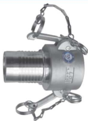
KAMLOK SNOW TRN SKK Rychlospojka s hadicovým trnem s páčky kód 30524