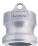
KAMLOK SNOW DP SS Záslepka trnu rychlospojky kód 30534