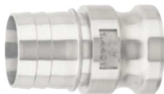
KAMLOK SNOW TRN SKS Rychlospojka trn pro SKK kód 30525