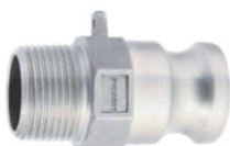
KAMLOK SNOW F SS Trn rychlospojky s vnějším závitem kód 30533