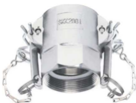
KAMLOK SNOW SKK I-G Rychlospojka s vnitřním závitem kód 30529