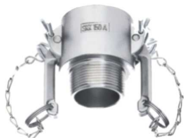
KAMLOK SNOW SKK A-R Rychlospojka vnějším závitem kód 30530