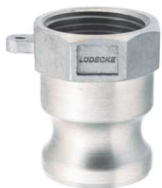
KAMLOK SNOW A SS Trn rychlospojky s vnitřním závitem kód 30532