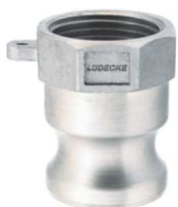
KAMLOK SNOW A SS Trn rychlospojky s vnitřním závitem kód 30532