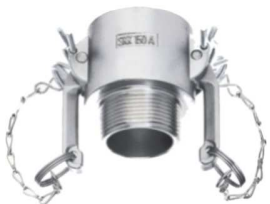
KAMLOK SNOW SKK A-R Rychlospojka vnějším závitem kód 30530