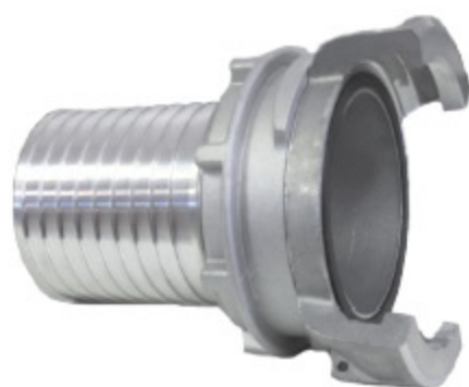
GUILLEMIN AL TRN - kód 30305 GUILLEMIN SS TRN - kód 30312