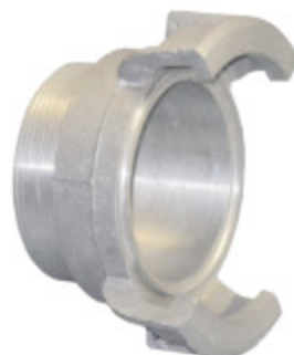
GUILLEMIN AL AG - kód 30307 GUILLEMIN SS AG - kód 30314