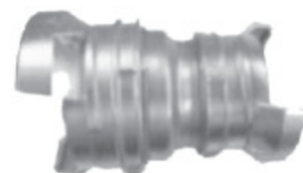
GUILLEMIN AL REDUKCE - kód 30311 GUILLEMIN SS REDUKCE - kód 30319