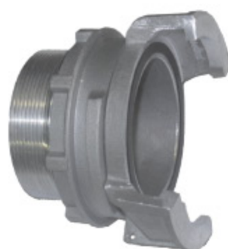
GUILLEMIN AL LOCK AG - kód 30306 GUILLEMIN SS LOCK AG - kód 30313