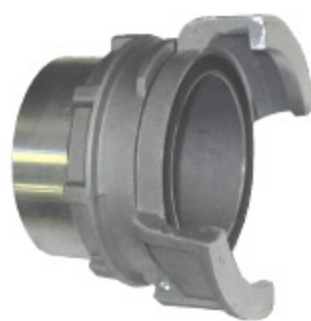
GUILLEMIN AL LOCK IG - kód 30308 GUILLEMIN SS LOCK IG - kód 30315