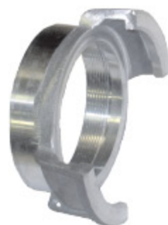
GUILLEMIN AL IG - kód 30309 GUILLEMIN SS IG - kód 30316