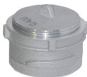
GUILLEMIN AL LOCK PLUG kód 30310