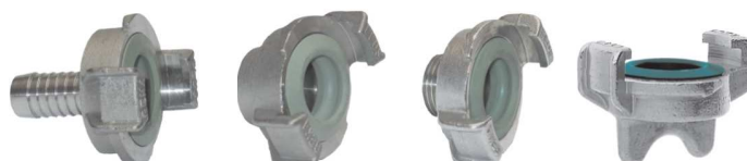
GEKA PLUS SS TRN kód 30186

Poznámka: K upínání doporučujeme spony ASFA nebo GBS. Pro použití na pitnou vodu doporučujeme GEKA PLUS KTW.