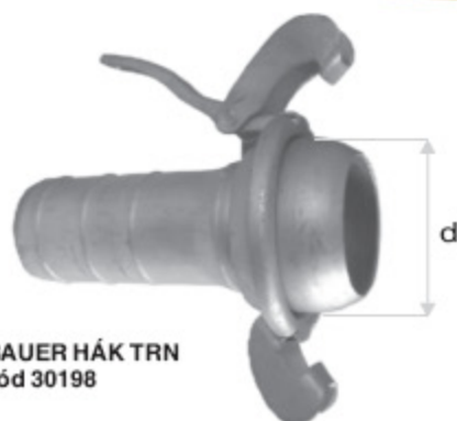
BAUER HÁK TRN kód 30198