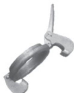
BAUER HÁK WELD kód 30201