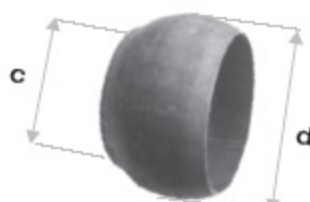
BAUER WELD K kód 30200