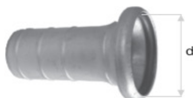
BAUER TRN kód 30199