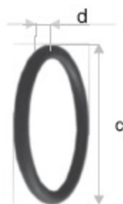
BAUER TESNĚNÍ kód 30206