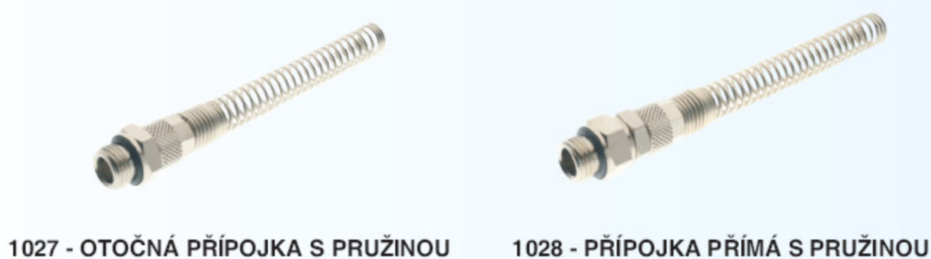
1027 - OTOČNÁ PŘÍPOJKA S PRUŽINOU