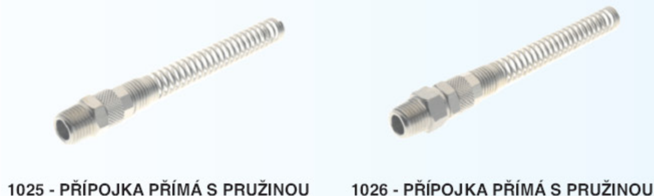
1025 - PŘÍPOJKA PŘÍMÁ S PRUŽINOU